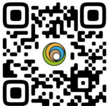
Группа в VKontakte